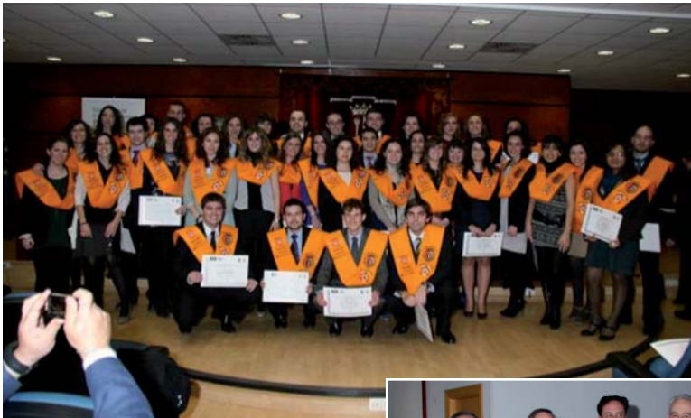
Alumnos y profesores de la primera edición del Programa

De los alumnos que realizaron prácticas en las empresas colaboradoras, más del 90% obtuvo una oferta de trabajo , bien para continuar en enero, bien para incorporarse en septiembre, siendo el grado de satisfacción con el Programa, tanto de empresas como de alumnos, muy elevado.